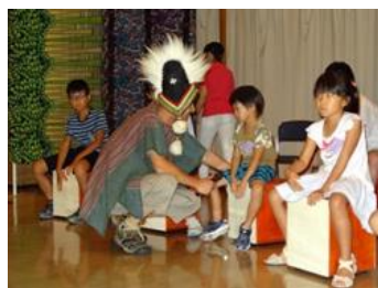
子どもセミナー 南米のリズムを楽しもう