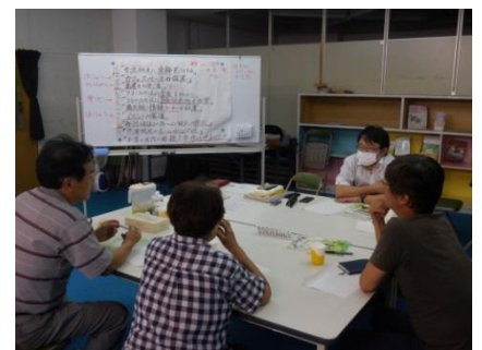
〔企画委員会の様子〕

企画委員会のメンバーが集まり、今まで選定してきた各案をプロジェクトとして実行することの必要性や新規案について検討を行いました。今後も引き続き検討を進めていき、企画の原案を作成します。