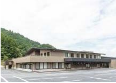
県より補助金交付が決定した グランビレッジ倉橋

答 奈良県施設開設準備経費等支援事業補助金は、介護保険法に規定する地域密着型特別老人ホーム、グループホーム、施設内保育所の開設に合わせた経費が対象となり、本市においては、今年度新設された介護複合施設のグランビレッジ倉橋が対象施設である。