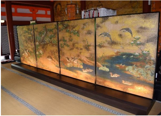
金銀の砂子が装飾された四面の襖