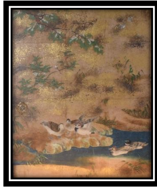
水辺に憩う鴨の姿