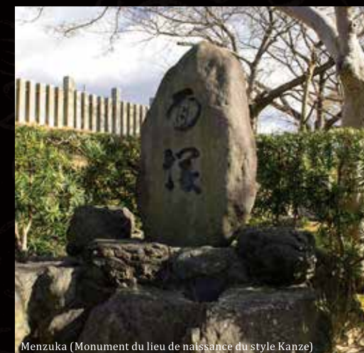
Menzuka (Monument du lieu de naissance du style Kanze)

Selon la légende, un shōgun aurait adoré la danse de Kan'ami, durant laquelle celui-ci attrapait un masque tombé du ciel pour le placer sur son visage. Kanami a vécu à Kawanishi-chō Yūzaki, et c'est là également qu'il a élevé le théâtre nōgaku au rang d'art.