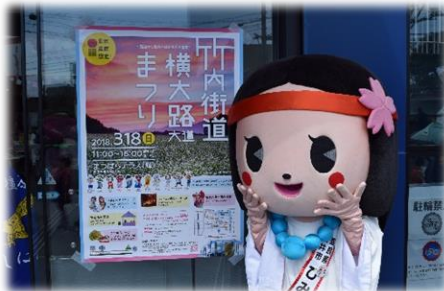
↑堺～明日香をつなぐぐるりんバスに乗車のお客様をお見送り