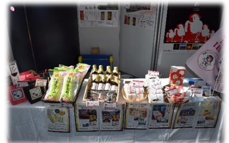
↑奈良食品の戒春雨、大門醬油の山椒しょうゆなども販売