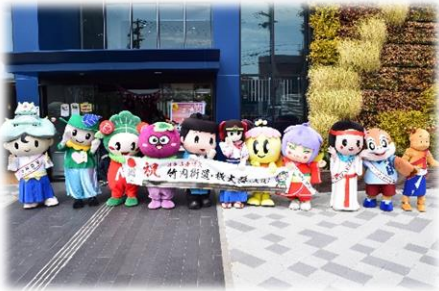
↑まつばらテラス前で集合写真

桜井市の物販ブースでは、かふえレストランさらいの「さらいのとろプリン」や吉方庵の「まきのもも」「三輪福来」などの大和さくらいブランド認定品を中心に販売し、桜井市の食の魅力を多くの方に紹介しました。