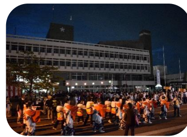
みんなで練習した桜井音頭のお披露目です