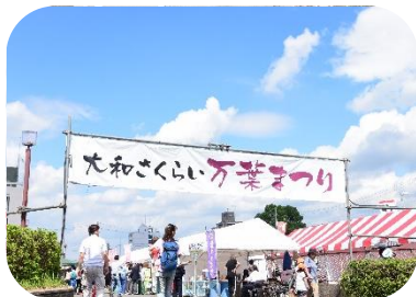
心配されたお天気もこのとおり！