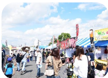
大勢の人で賑わう海石榴市