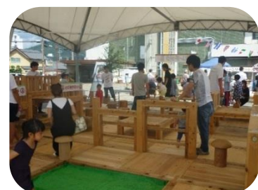
木のまち子ども広場の様子