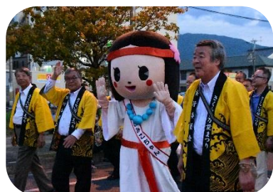
さあパレードの始まりだ！