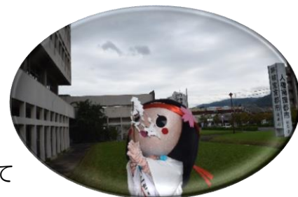
「天気になあれ！」と お願いするひみこちゃん

その甲斐もあり当日はすばらしい天候に恵まれ、市内外から大勢の方がお越しください。現代版「海石榴市」や木のまち子ども広場には多くの家族連れで賑わっていました。「桜井音頭・総踊り」には1,000人近くの方が参加してください、まつり全体では例年を上回る来場客数となりました。