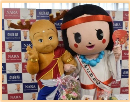
みんなからプレゼントをもらって ウキウキのせんとくん