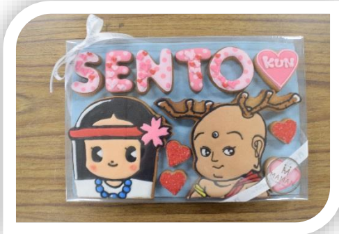
今年もMAMANさんにアイシングクッキーを作っていただきました

「ひみこちゃん通信」では、観光まちづくり課の取り組みや市内の観光・イベントの情報をお伝えします！