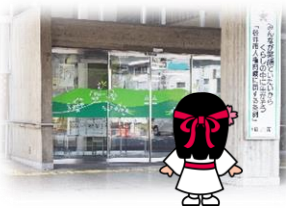
桜井市役所本庁舎 入り口から入ります。

新型コロナウイルスの流行により、全国的に外出の自粛が要請されていますが、こんなときは、おうちで旅行雑誌やパンフレットを広げ、頭の中で旅行気分を味わってみてはいかがでしょうか？桜井市観光まちづくり課でもたくさんのパンフレットを発行しておりますので、ご覧になりながら、イメージ旅行をたのしんでみてください！！