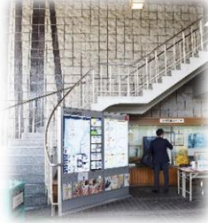
この階段を上ります。