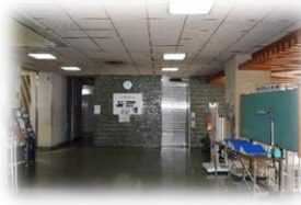
2F にごつてすぐにエレベーター があり左に曲がります。