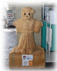
入るとすぐに木製の ひみこちゃんがお出迎え♡