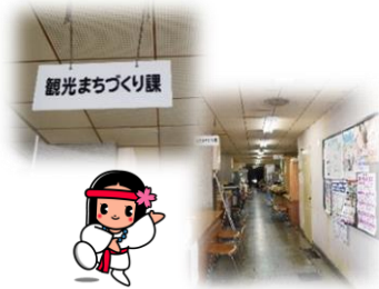
すぐに観光まちづくり課があります。

https://www.city.sakurai.lg.jp/siki/machidukuribu/kankouka/pamphlet/1583738087127.html