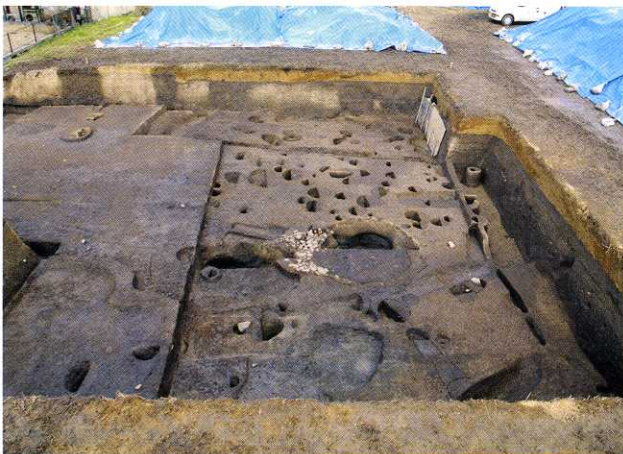
写真1 1区の柱穴群（南から）

2つの井戸の時期については、新しい井戸に堆積した土層から出土した土器の時期が布留0式期（3世紀後半）と考えられますので、新しい井戸の廃絶時期については布留0式期で、掘削時期は布留0式期を含めそれ以前と考えられます。なお、この2つの井戸が3棟の建物（建物B、C、D）に伴うかどうかは明らかではありません。