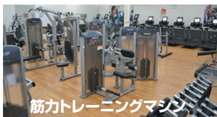
筋力トレーニングマシン

2023年 12/31(日)までに このチラシを 見た方には 【プロテイン1kg】 プレゼント