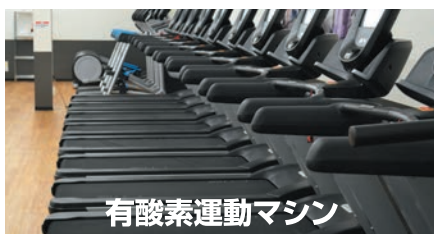
有酸素運動マシン