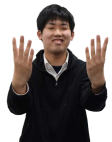
②明るい表情で、両手を上げながらパッと手を開きます。