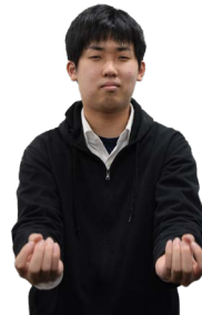
①両手の指を上に向けて軽くつまみます。