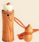
さくらい木町「塗香入れ」