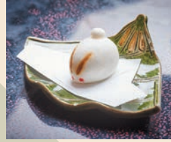
やまどのうさぎまんじゅう