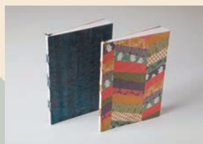
ならわしノート・ 現代和綴