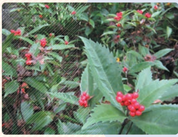
■ 千両 (聖林寺)