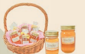
Himiko (日本ミツバチのはちみつ)