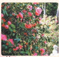
■ 椿 (玉列神社)

桜の名所 安倍文殊院 安楽寺 金屋河川敷公園 瀧蔵神社 倉橋ため池 ふれあい公園 満願寺 長谷寺 談山神社