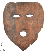
奈良県指定有形文化財

3世紀前半の木製の鍬を転用して作られた仮面で、目や口、鼻のほか線刻によって眉毛を表現しています。同じ土坑からは、木製の鎌の柄や盾が出土しており、これらを使用した祭祀が行われたと考えられます。