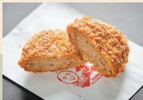
名物 ミワコロッケ