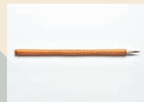
さくらい木町「写経筆」