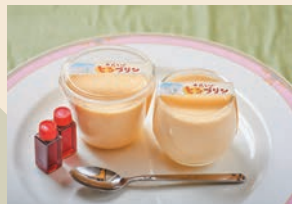
さらいのとろぷりん