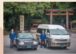
記紀万葉ふるさと巡り ツアータクシー