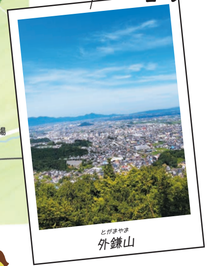
とがまやま 外鎌山