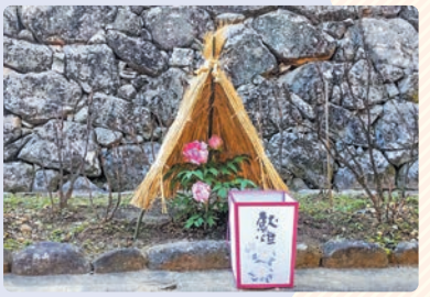
■ 冬に咲く牡丹 (長谷寺)