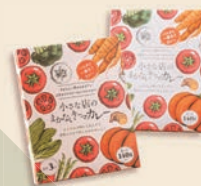
パスタに一番合う カレーソース