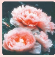
■ 牡丹 (長谷寺)