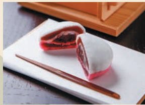
やまとびと 女夫饅頭