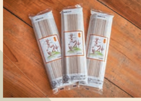
荒神の里・笠そば(乾麺)