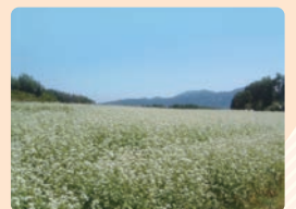
■ そばの花 (笠地区)