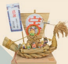
わらしべしめ縄宝船