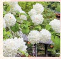
■ オオデマリ (長谷寺)