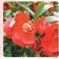
■ ぼけの花 (安倍文殊院)