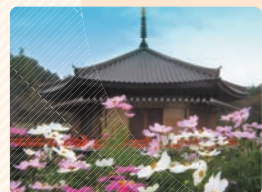
■ コスモス (安倍文殊院)