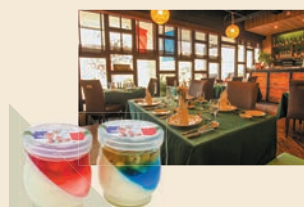
季節のブランマンジェ