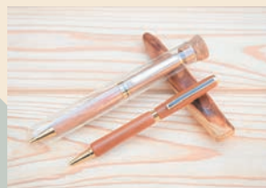
鼓の里 木製ボールペン 桜