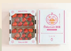
OdaMaki農園の 特別栽培いちご