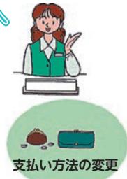
支払い方法の変更