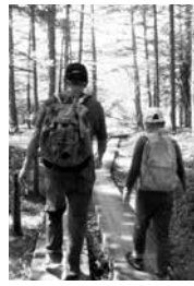
鎮守の森を観に行こうかい