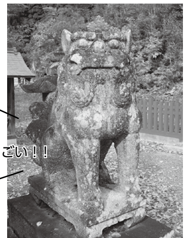
昔の天皇の宮の場所と 伝えられてるなんてすごい！！