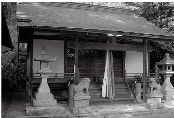
ひきた 乗田神社 (白河)