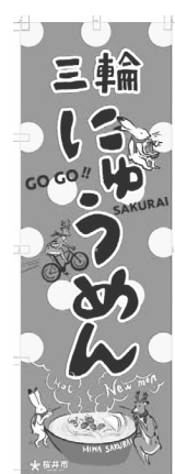
のぼり旗イメージ▲