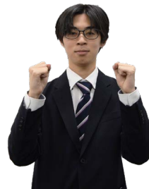
①腕を立て、両手のグーを向き合わせる。