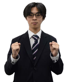
②両肘を同時に下ろす。