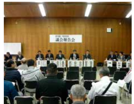
議会報告会のようす

答 市においては、BCP（大きな災害が起こった際の業務継続計画）を作成しているが、議会として、議員としての行動マニュアルや計画なるものは議論中である。今年度中には、見えるようなかたちにしていきたい。