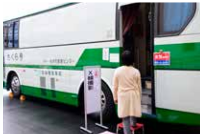
集団健診 (がん検診)

※毎年の受診で健康チェック。あなたの好みで集団健診・個別健診 (医療機関) が選べます。