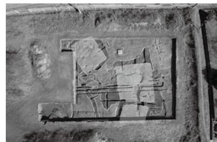
白いアミカケが方形周溝墓 (上が東方向)

り、メクリ 1 号墳と名付けられた前方後方墳の濠の痕跡など今回見つかった方形周溝墓以外にも複数のお墓が見つかっています。そのため一帯は纏向遺跡の中でもお墓があつまる墓域として用いられていたものと考えられます。