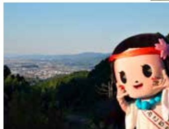
箸墓・三輪山を一望 (高家)