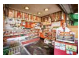
末広精肉店 桜井市大字三輪361-1 ☎42-6345 営業時間：9時～19時、定休日：木曜日