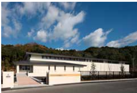
新学校給食センター

答 過去からの負の遺産が後世の負担とならぬよう、気を引き締めて行政にあたることに、できるだけ経費の節約等を行いたい。