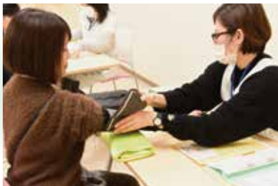
集団健診 (血圧測定)