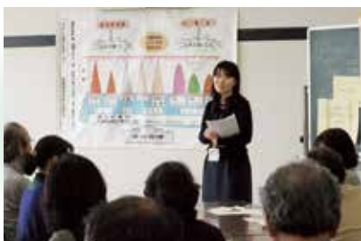
特定健診結果説明会