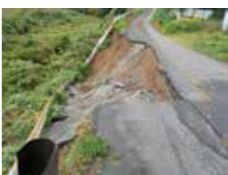
道路崩落の様子 (吉隠地区)

1月11日③、平成30年第1回臨時会が開催されました。昨年、10月21・22日の台風21号による、市内各所での床上、床下浸水や土砂崩れ、倒木等の被害による、災害復旧費の所要額が可決されました。