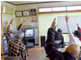
地域での高齢者活動

答 総合戦略でも示した通り、本市も超高齢社会を迎えようとしている中、地域包括システムの構築をさらに進めて行くには、高齢福祉課と密接な連携を取る必要がある。また、次の段階へ進めるためには、介護予防・日常生活支援総合事業等の一体運用が必要であることから、組織改正を行った。