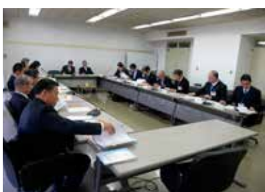
産業建設委員会のような

答 給食の開始時期を小中学校同時にするよう、委託業者と調整をしたが、職員の人員配置が間に合わないため、分けて行うこととなった。