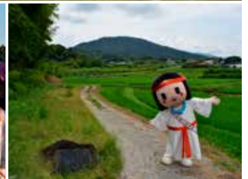
額田王の万葉歌碑からの 三輪山の眺望 (穴師)