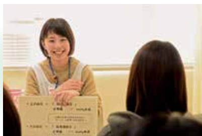
わかざくら健診結果説明会