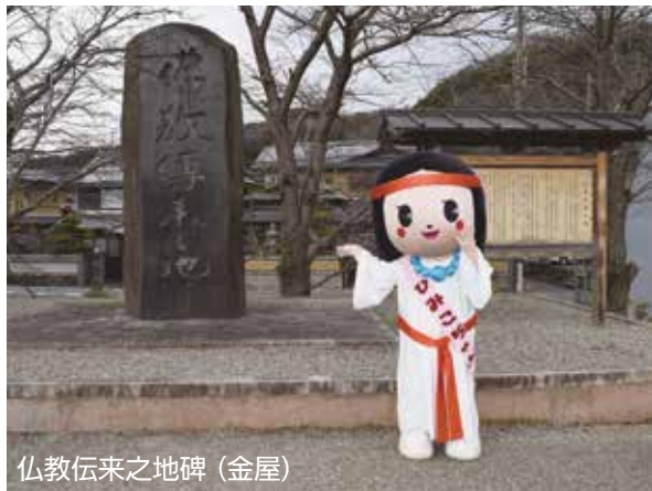
仏教伝来之地碑 (金屋)