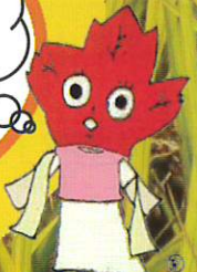
吉隠のマスコットキャラクター かえでちゃん