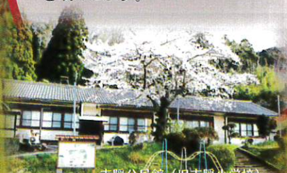
吉隠公民館 (旧吉隠小学校)

旧吉隠小学校の木造校舎では、記紀万葉 の時代にはじまる村の歴史や四季折々の里 山風景、子どもたちの農業体験のようすなど を展示します。