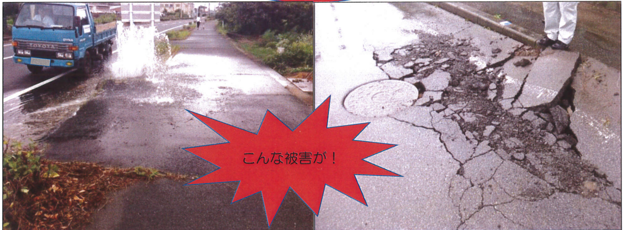
【マンホールからの下水噴出】