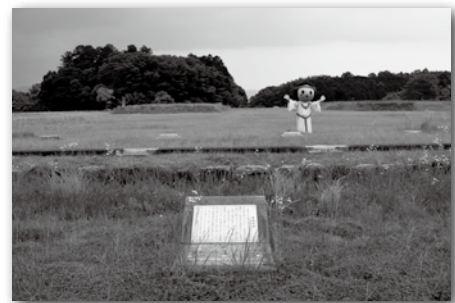
出土した東回廊のあと

山田寺跡は、昭和51年から発掘調査が始まり、昭和57年の調査では倒壊した東回廊がそのままの形で出土し、すごく貴重な発見だと言われているよ。また、今は奈良市の興福寺にある国宝の銅造仏頭（旧東金堂本尊）は白鳳時代の素晴らしい彫刻とされているけれど、もともとは山田寺にあったものなんだって！