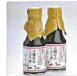
蔵造り奈良絵 木桶仕込みしょうゆ