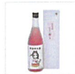
古代米酒 寄物呼の里