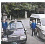
記紀万葉ふるさと巡り ツアータクシー