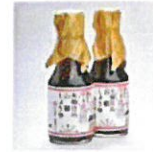
蔵造り奈良絵 木桶仕込み山椒しょうゆ