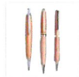
談の里 木製ボールペン