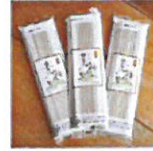
荒神の里 苧そば(乾燥)