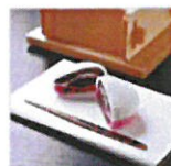
やまとびと 夫婦饅頭