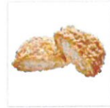
名物 ミワコロッケ