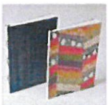
ならわしノート・ 現代和綴帳