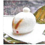
やまとうさぎまんじゅう