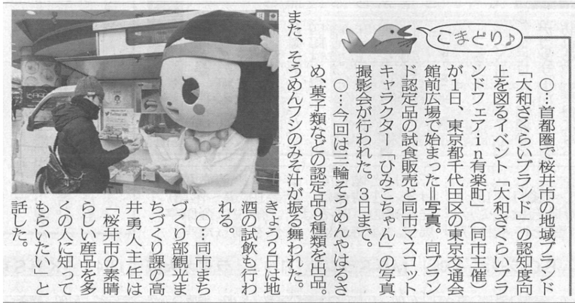
奈良新聞(2019年2月2日付)