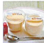
さらいのとろプリン