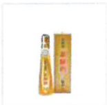
談山 貴醸酒 兼醸酒