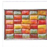
柿の葉すし山の辺