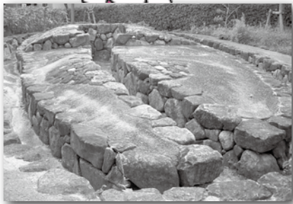
出土した遺構（復元）