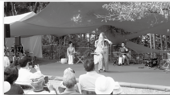
昨年の土舞台でのイベントの様子