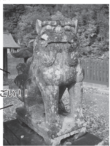
昔の天皇の宮の場所と伝えられてるなんてすごい！！