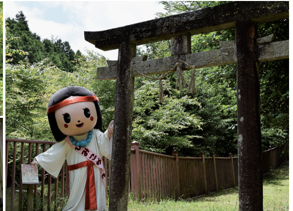
迹驚淵(左上)と高山神社(左下・右)