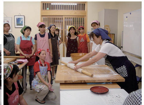
そばの実(左)とそば打ち体験の様子(右)