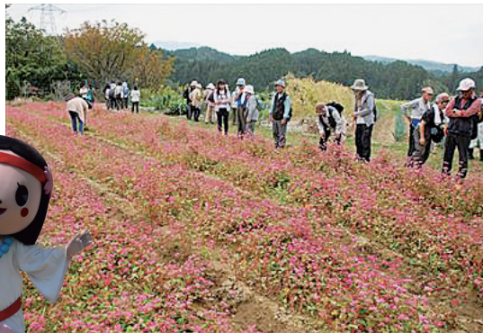
真っ赤なそば畑だね～！

また「里地里山を守り活かし楽しむ会」が定期的で開催され、この会では赤い花のそばや古代米の栽培にすることができ、そば畑の手入れ、古代米の稲刈り、稲架かけ、脱穀、唐箕選、粉摺り等の体験ができます。