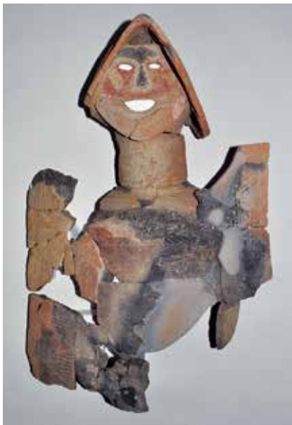
↑日本最古の盾持人埴輪

市教育委員会による発掘調査において、日本最古の「 たてもちびとはにわ 盾持人埴輪」が出土し、大きな話題となりました。この盾持人埴輪は、盾を持つ人の形を模しています。高さ67cm以上、幅50cmで目と口は穴で表現されており、鼻の部分は粘土を貼り付けていた形跡があります。