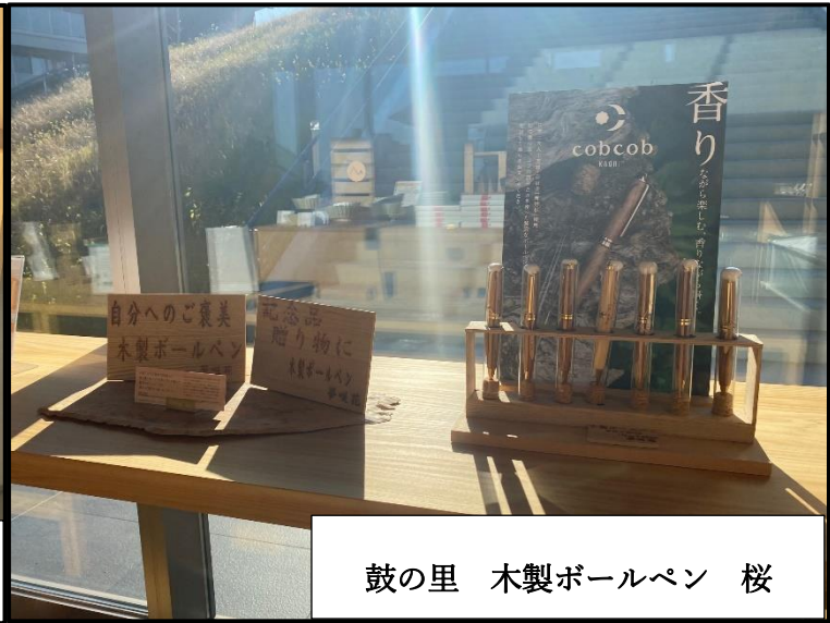
鼓の里 木製ボールペン 桜