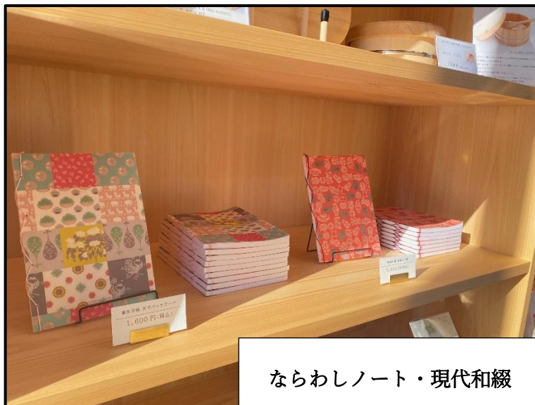
ならわしノート・現代和綴