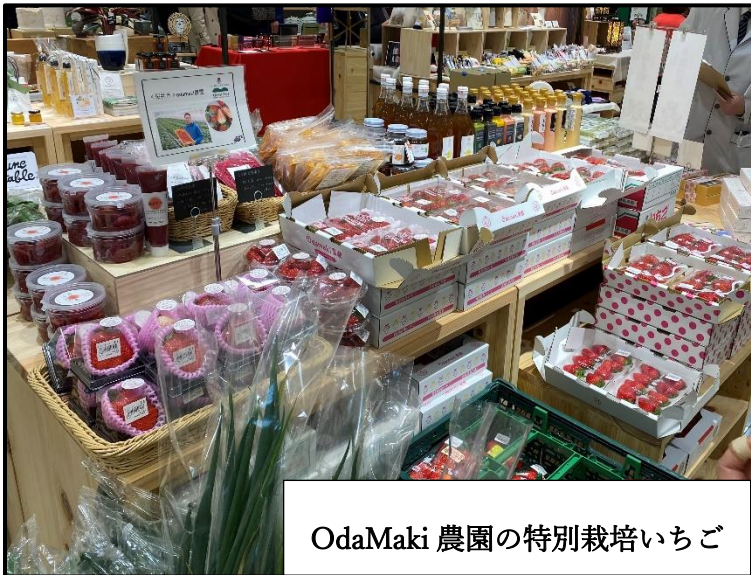
OdaMaki 農園の特別栽培いちご