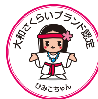
大和さくらいブランド 認定マーク