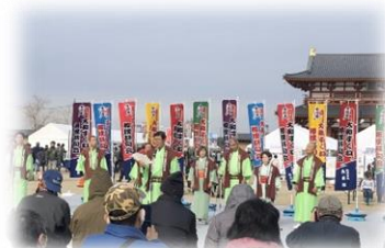
大和すくね相撲甚句会の皆さん

3月には大相撲桜井場所も開催されるので、相撲の歴史等を含め沢山の方に興味を持っていただきたいです。