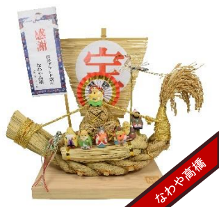
わらしべしめ縄 宝船