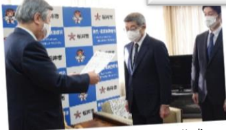
大和さくらいブランドの授賞式