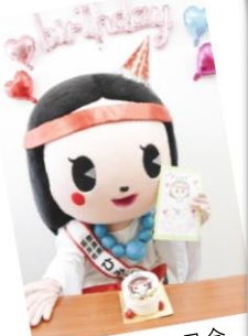
ひみこちゃん誕生日会