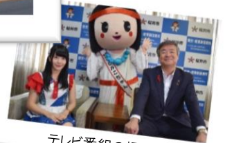
テレビ番組の撮影