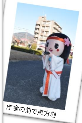
庁舎の前で恵方巻